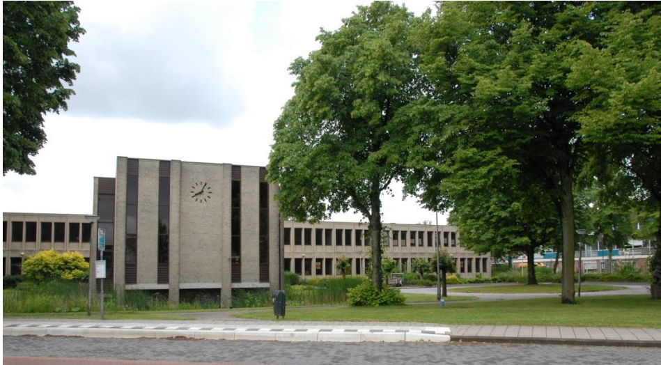
Voorzijde gemeentehuis 's-Gravendeel

De locatie ligt naast het centrum van 's-Gravendeel aan de Korte Smidsweg 22 en is goed bereikbaar vanaf de N217. Men zit via de Kiltunnel binnen 6 autominuten op de snelweg A16 en in 15 minuten op de A29. Er is een bushalte voor de locatie. Op de locatie staat het gemeentehuis met een aantal parkeerplaatsen, een vijverpartij en veel groen. Het totale terrein is ca. 5350m 2 . Het gebouw is ca. 2460m 2 BVO. In bijlage A1 (a en b) zijn de gebouwenkenmerken en de kadastrale gegevens weergegeven. Het gemeentehuis is opgeleverd in 1980.